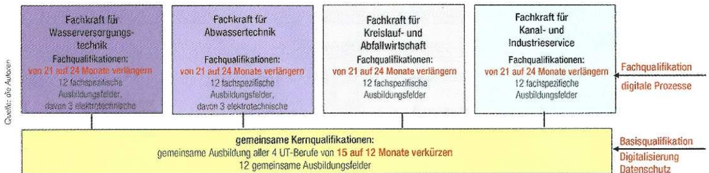
Abb. 2: Die vier Umweltberufe müssen digitale Basis- und Fachqualifikationen vermitteln.